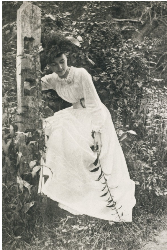
Fotografie éry historismu (pozdní 19. století)