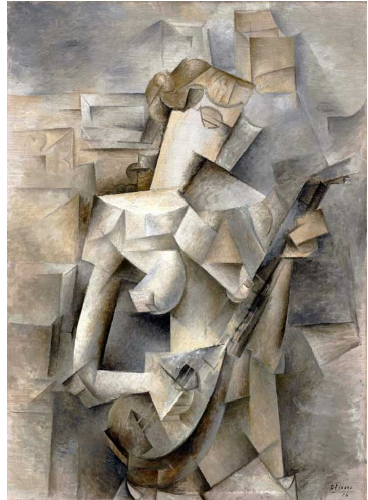
Pablo Picasso: Dívka s mandolínou (1910)