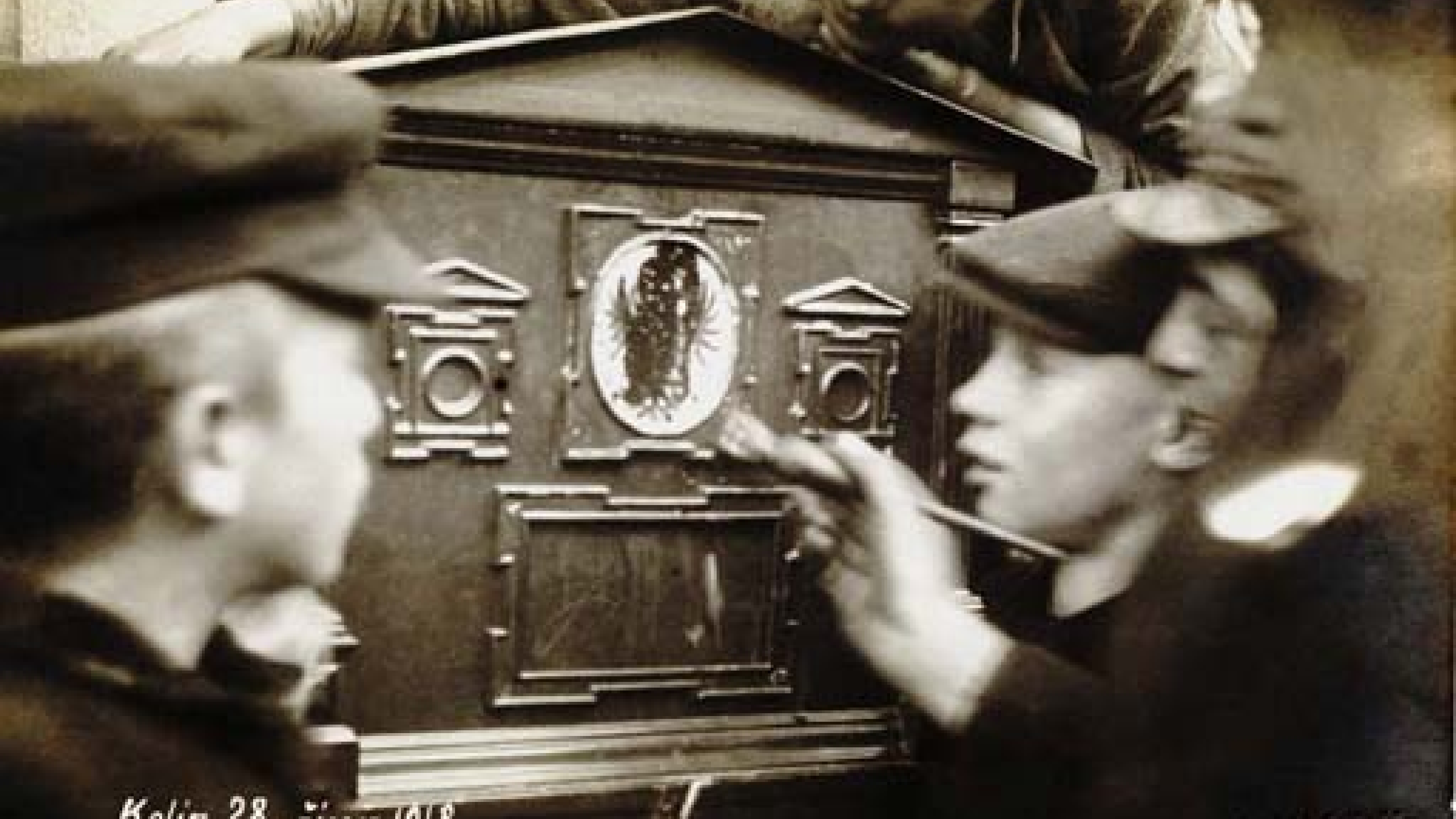
Kalin 28 51/1018