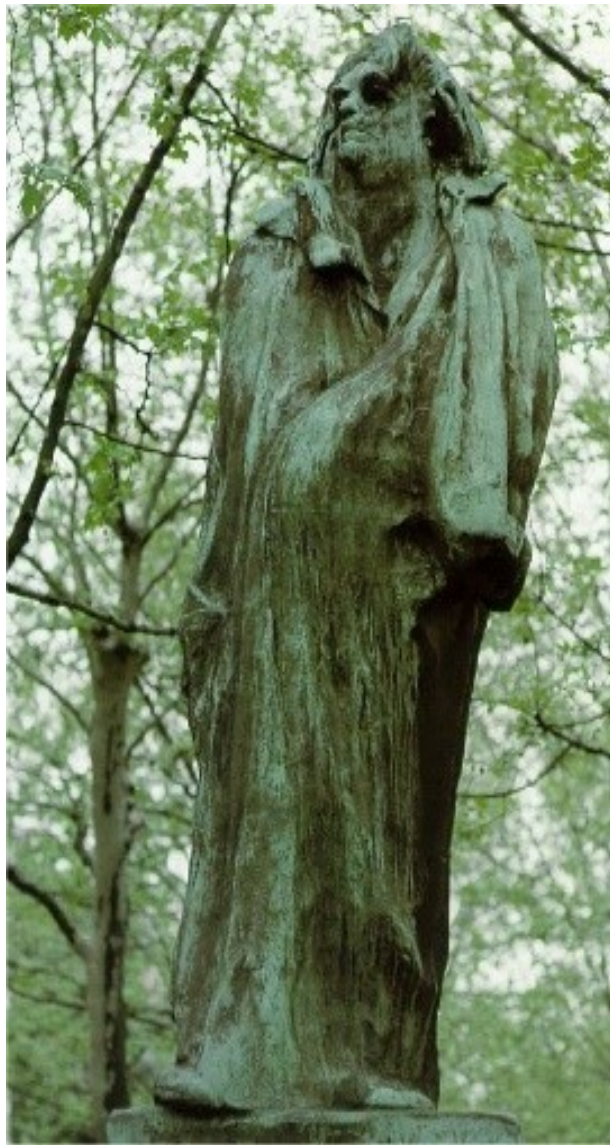
Auguste Rodin Balzac, přelom 19.-20. století.