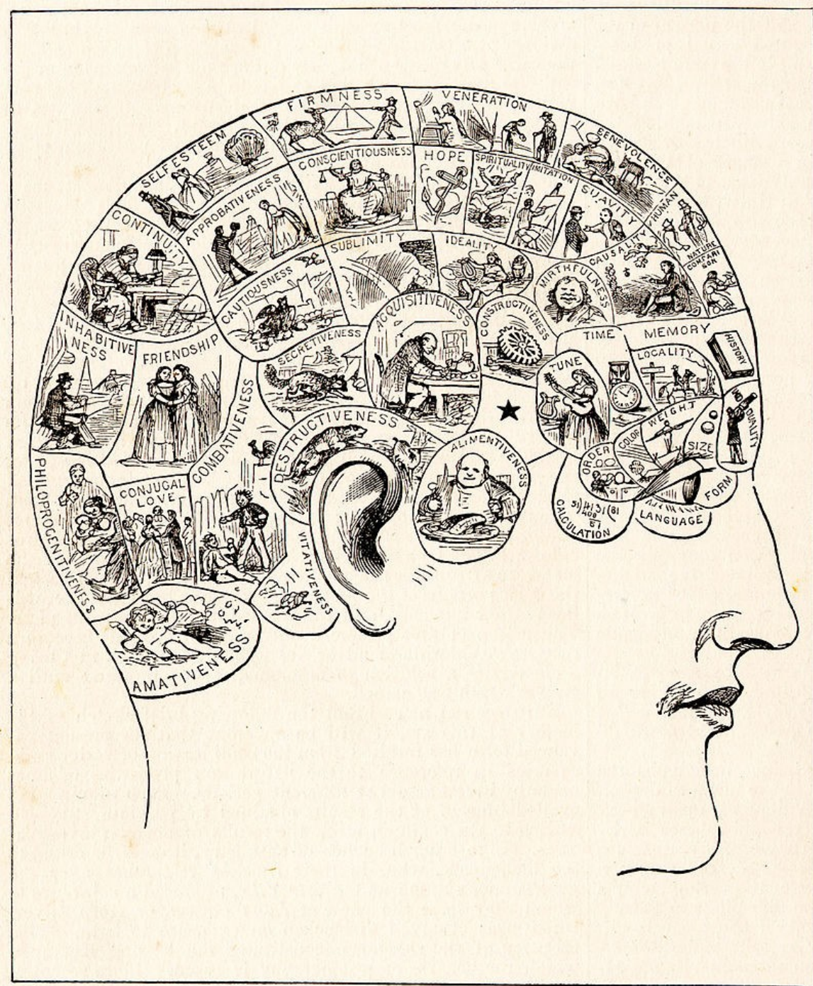
Phrenological Chart of the Faculties.