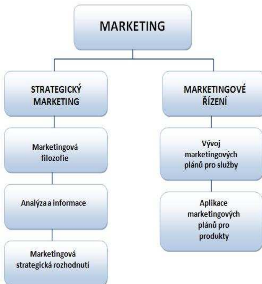
Obr. č. 2 - Role marketingu ve strategickém řízení

Strategický marketing popisuje takové aktivity, které ovlivňují marketingové strategické plány celé knihovny.