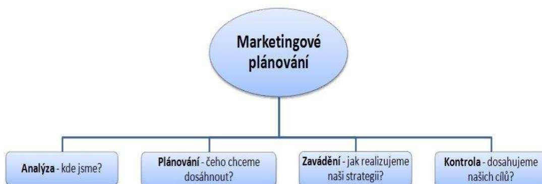
Obr. č. 1– Marketingové plánování (JANEČKOVÁ, L.; VAŠTÍKOVÁ, M. Marketing služeb . Praha : Grada Publishing, 2001, s. 55)

Marketing představuje integrovaný komplex činností zaměřených na sledování postojů uživatelů a situace na trhu. Jedná se o systematické úsilí všech zaměstnanců knihovny ad. zainteresovaných subjektů, které usilují o vzájemnou spolupráci a o koordinaci svých aktivit. Marketing usiluje o to, aby knihovna poskytovala takové služby, jež uživatel požaduje, a to tím, že jeho potřeby a přání zjišťuje a že mu své služby přizpůsobuje. Veřejný sektor se soustřeďuje především na naplňování společenských potřeb. Knihovna plní především úlohu vzdělávací. Jedním z cílů může být počet uživatelů, ale také stanovené a vnější užitky. Vzdělávací aj. aktivity knihoven jsou prospěšné nejen samotným uživatelům, ale potažmo celé společnosti. Uživatelem veřejných knihoven se může stát nejen každý občan, ale i celá společnost, která tak získá vzdělané jedince.