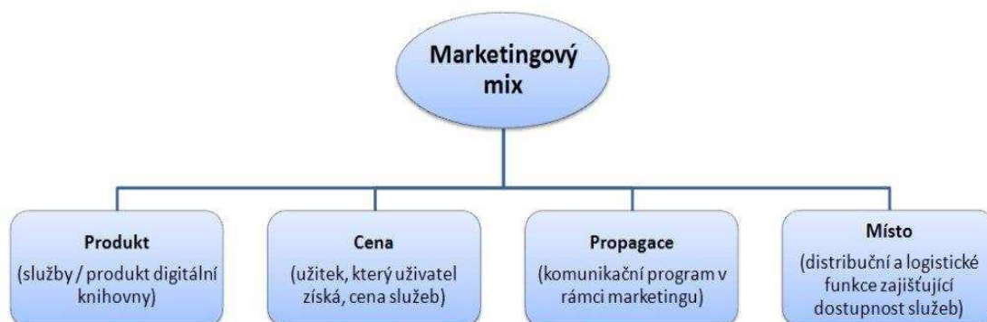
Obr. č. 4 - Marketingový mix