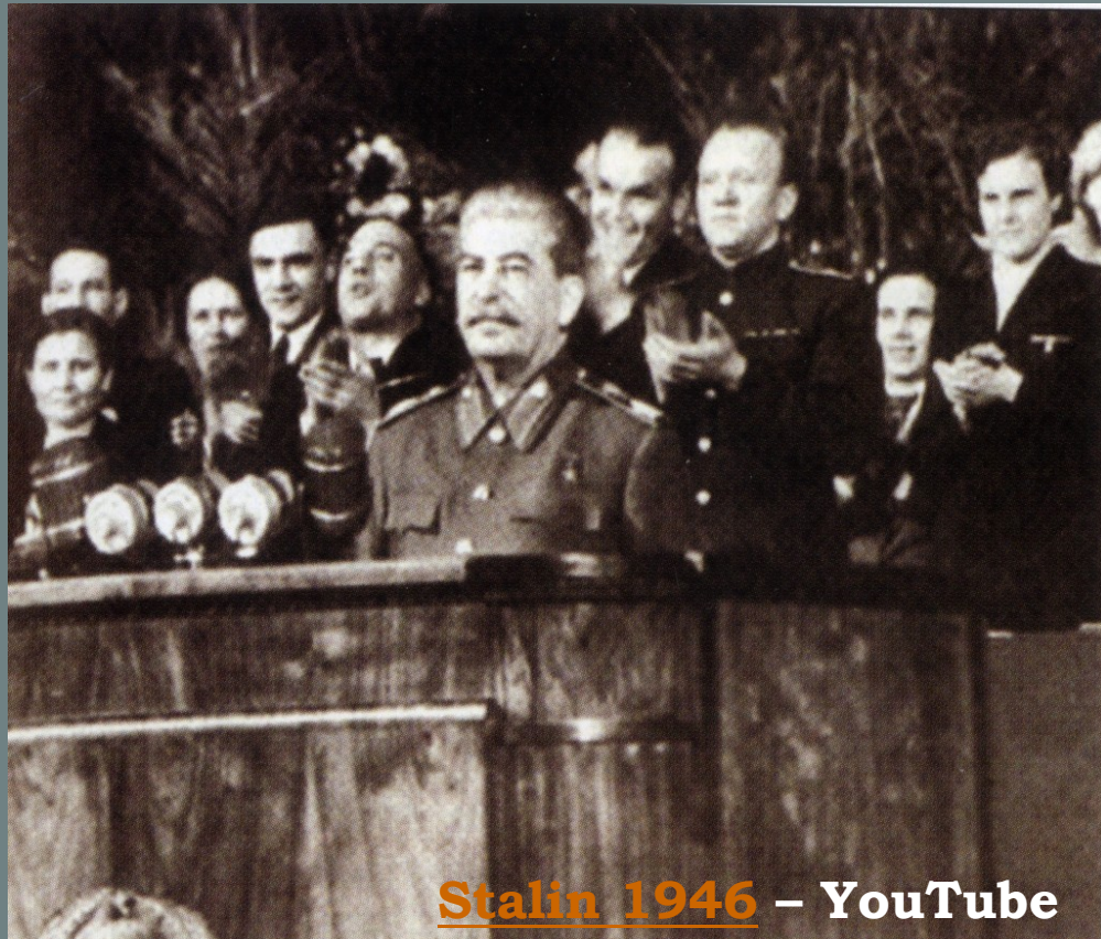
Stalin 1946 – YouTube