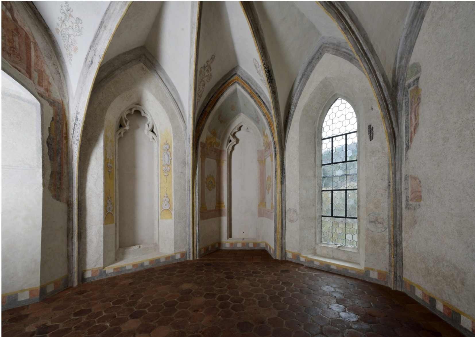
Opatská kaple ve Zlaté Koruně