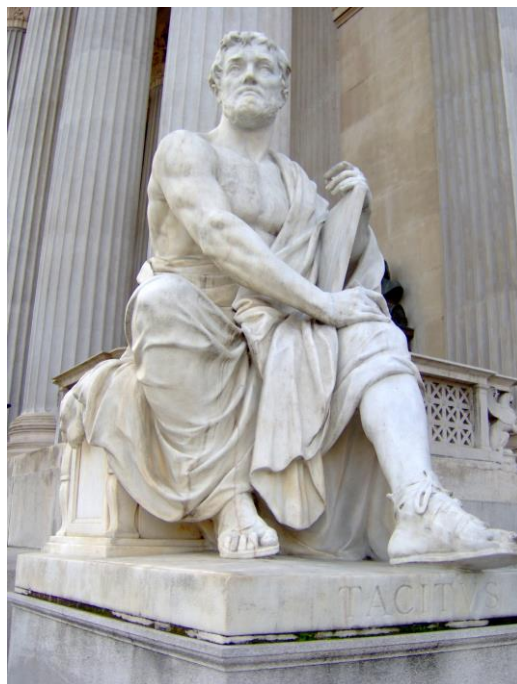
Obrázek 4: Publius Cornelius Tacitus, moderní socha umístěná před budovou parlamentu ve Vídni

Historická díla starověku racionalizovala zakladatelské mýty, postupně se také prosazovala představa o lineárním plynutí času, na kterou záhy navázalo pozvolna se prosazující křesťanství. Křesťanství na dlouhá staletí výrazně ovlivnilo koncepci času a filosofii dějin. Díla sv. Augustina (354–430), zejména „O boží obci“, položila základ křesťanského konceptu času jako Božího výtvoru, linearitu mezi stvořením a posledním soudem. Křesťanské pojetí dějin je teleologické (tj. že dějiny směřují k nějakému cíli), eschatologické (že tímto cílem je spása) a providencialistické (tj. že dějiny jsou vedeny Boží prozřetelností), což se odráželo v prvních křesťanských dějepisných dílech, která se zaměřovala na dějiny církve a osudy mučedníků.