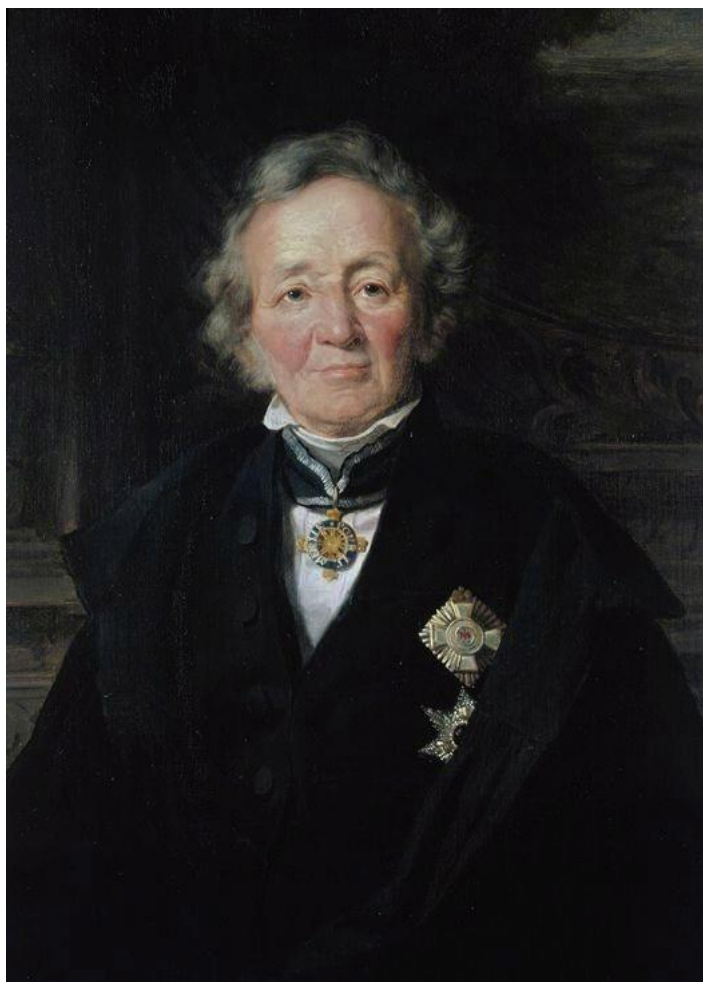
Obrázek 8: Franz Leopold von Ranke (1795-1886), jedna ze zakladatelských osobností moderní historické vědy

Pozitivismus v historiografii se vyznačoval snahou shromáždit veškeré dostupné prameny, podrobit je přísné vnitřní a vnější kritice, odhalit falza a nezpochybnitelně pravé dokumenty sestavit do genetické řady podle vzájemných závislostí. Poznání tak postupovalo de facto kumulativně, s rezignací na deduktivní rekonstrukci. Francouzský historik Ernest Renan († 1892) v roce 1890 sebevědomě prohlásil, že za sto let budeme vědět o minulosti všechno. Ovšem dnes již víme, že poznání minulosti nelze oddělit od přítomnosti a že je nekonečně proměnlivé.