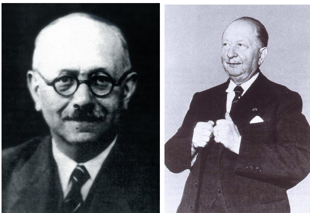
Obrázek 9: Marc Bloch (1886-1944) a Lucien Febvre (1878-1956), zakladatelské osobnosti francouzské školy Annales

Do jisté míry na okraji probíhajících metodologických třenic se pohyboval Johann Hui- zinga († 1945), nizozemský historik a jeden z nejvýznamnějších představitelů tzv. klasické kulturní historie. Autor dodnes vlivných prací „Podzim středověku“ či „Homo ludens“ v mnoha ohledech navazoval na Švýcara Jacoba Burckhardta († 1897), průkopníka kulturních dějin a vynikajícího znalce italské renesance. Komparativnímu studiu civilizací se v téže době věnovali Oswald Spengler († 1936, Untergang des Abendlandes ) a v Londýně žijící Arnold Joseph Toynbee († 1975, A study of history ).