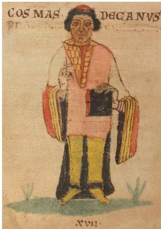
Obrázek 5: Vyobrazení kronikáře Kosmy v lipském rukopise jeho kroniky

Vznik univerzit vedl k laicizaci vzdělání a ke zrodu středověkého intelektuála, postupně se rozšiřoval okruh konzumentů psané literatury. Vrcholný a pozdní středověk se také nesl ve znamení průniku národních jazyků do oblastí vyhrazené v předchozích staletích latině. Výrazného rozmachu doznala i historiografie, objevují se dějiny nejrůznějších sociálních skupin, rodové historie, biografie, kvetlo dvorské kronikářství.