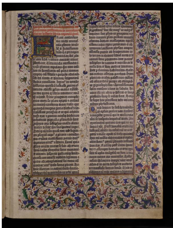
Obrázek 6: Gutenbergova Bible (zvaná také B-42), nejstarší pohyblivými literami tištěná kniha západního světa, vznikla mezi roky 1452 a 1454 v mohučské dílně Johannese Gutenberga

Nejstarší knihy vytištěné pohyblivými literami mezi rokem 1454 (rok vydání Gutenbergovy Bible) a rokem 1500 označujeme termínem prvotisky alias inkunábule (z latinského in cunabulis , v kolébce). Knihy vytištěné mezi léty 1501 a 1800 pak nazýváme staré tisky .