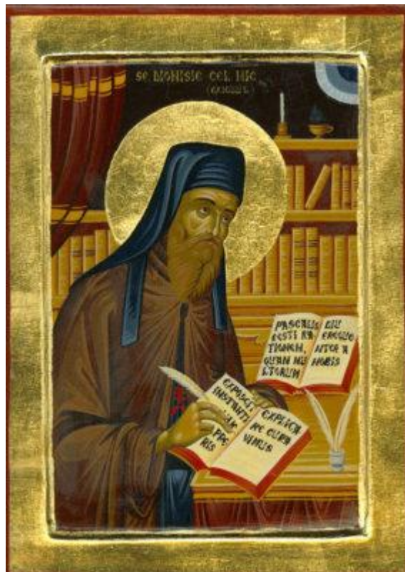
Obrázek 12: Dionysius Exiguus (475-544), tvůrce křesťanského letopočtu (éry)

od Vtělení Ježíše Krista (anni Domini Iesu Christi). Dnes již není přesně známo, jakým způsobem datum Kristova narození vypočítal (ačkoli historikové stanovili stran jeho uvažování pravděpodobné hypotézy). Na prahu 8. století mu však uvěřil Beda Ctihodný († 735), jenž podle stanoveného Kristova letopočtu uspořádal své dílo Církevní dějiny Anglů. Mimořádný respekt, jemuž se Beda těšil, vedl k tomu, že se latinskou Evropou začala záhy šířit představa, že se něco stalo po Kristu a něco před Kristem (tedy před a po narození spasitele). Tento způsob členění toku času užíváme dodnes, jen v letech komunistické nesvobody bývalo jméno Ježíše Krista nahrazováno nábožensky indiferentními termíny před naším letopočtem a po něm.