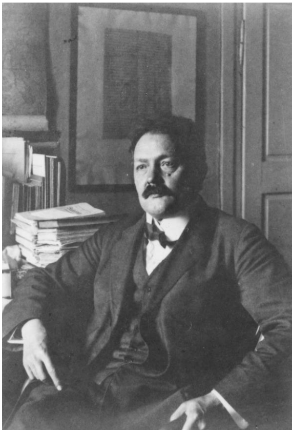
Obrázek 14: Český historik Josef Pekař (1870-1937)

Vedle klasického členění dějin na starověk, středověk, (raný) novověk a období nejnovější se lze setkat s odlišnými koncepty, jež odrážely specifické potřeby a přístupy některých významných badatelských osobností či historických škol. V předchozí kapitole byla zmíněna teorie dlouhého trvání Fernanda Braudela. S provokativní periodizací dějin středověku přišel ovšem i další z významných reprezentantů francouzské historické školy Annales Jacques Le Goff, jenž razil, metodicky opřen o dějiny mentalit, pojetí velmi dlouhého středověku. Jeho počátky spojil s obdobím pozdní antiky, od 10. století se pak měl postupně dělit na tři postupující se fáze: na tzv. střední středověk (trvajícím přibližně od roku 1000 po čas morové epidemie z poloviny 14. století), pozdní středověk (vymezený stoletou válkou mezi Anglií a Francií a nekatolickou reformací) a konečně dlouhý podzim středověku, který se v rovině politických struktur zakončil až Velkou francouzskou revolucí a v oblasti mentalit až s průmyslovou revolucí v 19. století.