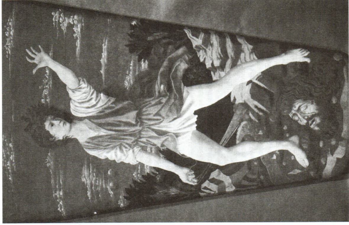
ANDREA DEL CASTAGNO, Mladistvý David. Malovaný štít. National Gallery of Art, Washington, Widener Collection, inv. č. 1942, 9. 8.

Nejzávažnější rozdíl je pravděpodobně mezi patrony, zpravidla vévoddy, kteří vzali umělce do svých služeb více či méně natrvalo (Leonardo v Miláně, Mantegna v Mantově apod.), a zákazníky, kteří obvykle objednali jen jedno dílo. Z hlediska umělců, jak dalece to lze vůbec rekon-