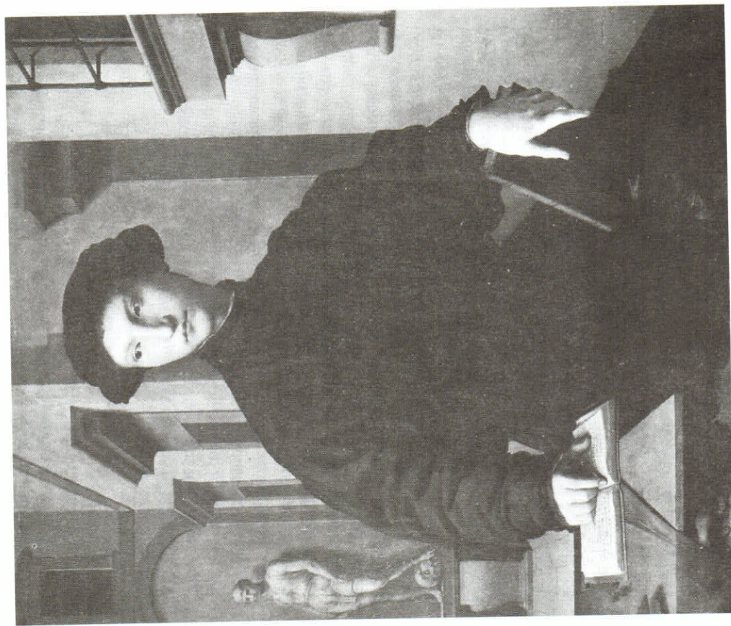
AGNOLO BRONZINO, Ugolino Martelli. Gemäldegalerie, Staatliche Museen, Preussischer Kulturbesitz, Berlin

rodinné vztahy k Medicejským: jeho otec pro ně pracoval před jejich vyhnáním z Florencie v roce 1494. Po jejich restauraci v roce 1513 se Baccio představil bratrům Giovannimu (brzy se stal papežem jako Lev X.) a Giulianovi, nabídl jim dar a oplátkou obdržel objednávku. Bandinelli pracoval rovněž pro Giulia de' Medici, který se stal papežem jako Klement VII. Očekával zakázku na náhrobky obou medicejských papežů a v této věci navštěvoval kardinála Salviatiho tak často, že byl omylem považován za zvěda a málem zavražděn (Boase, 1979; Vasari, Život Bandinelliho ).