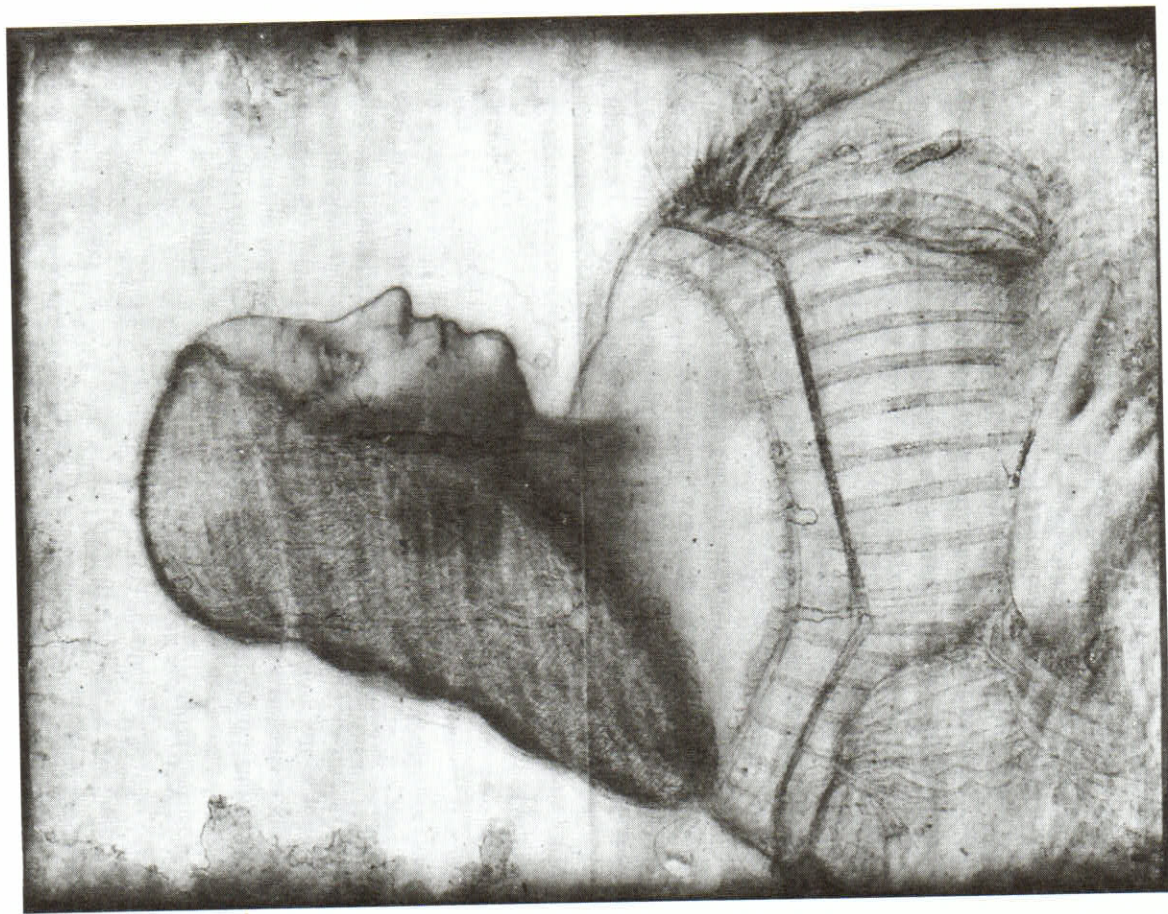
LEONARDO DA VINCI, Isabella d'Este. Kresba. Musée du Louvre.