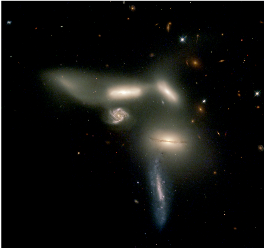
Obrázek 3: Kupa galaxií Seyfertův sextet. Galaktická skupina je od nás vzdálena přibližně 190 milionů světelných let.