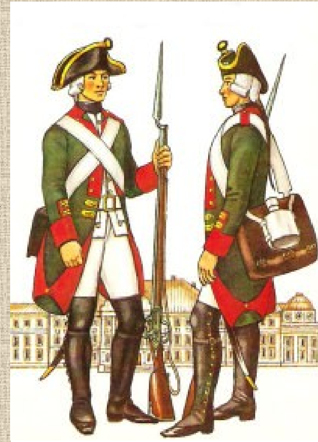
Armáda představovala jednu z mocenských opor Ruské říše