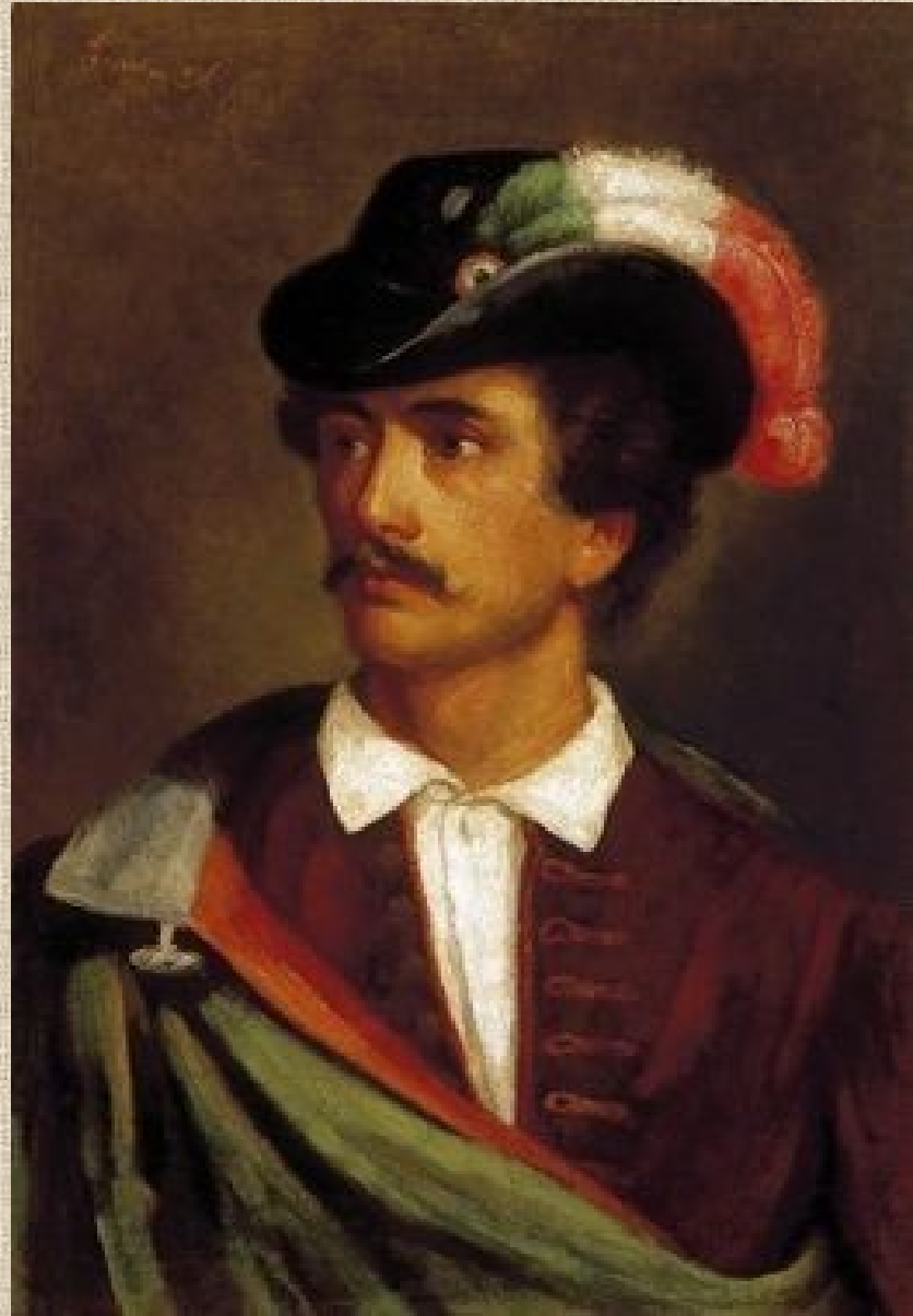
Maďarský básník Sándor Petöfi