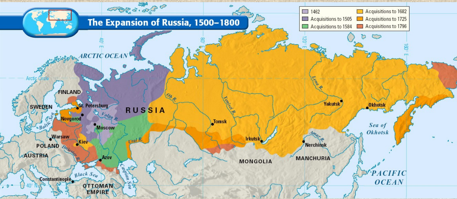
Územní výboje Ruska mezi lety 1500 až 1800