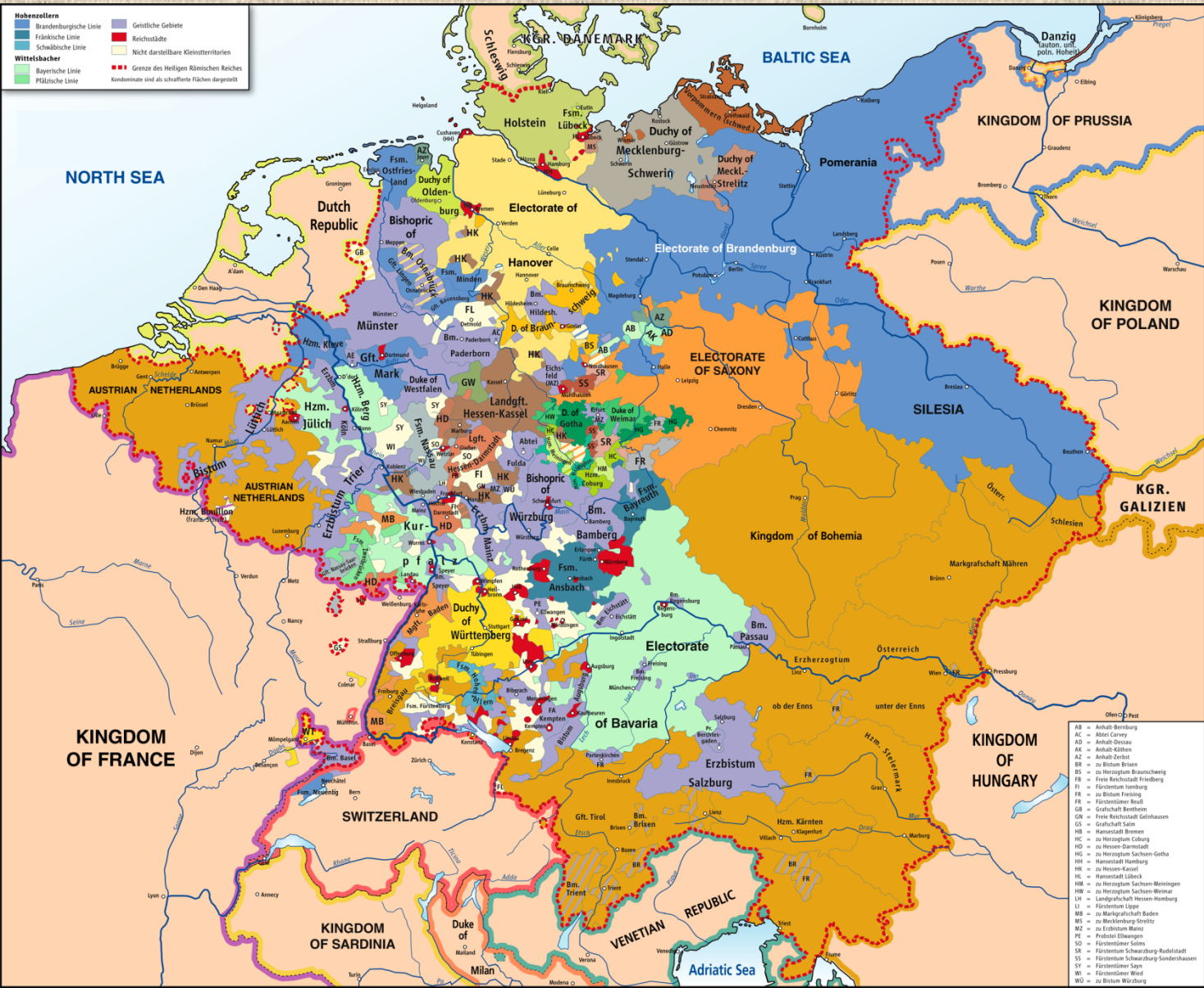
Střední Evropa v r. 1789, před vypuknutím Velké francouzské revoluce