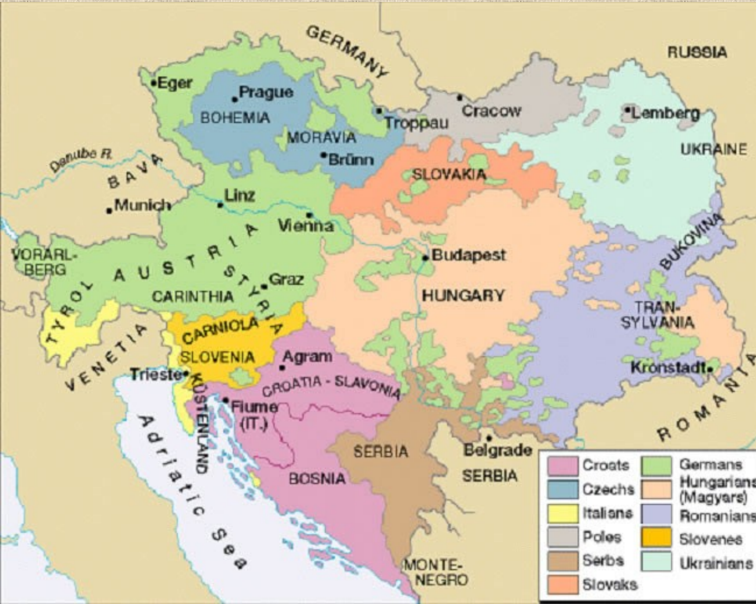
Národnostní mapa Rakouska v r. 1848