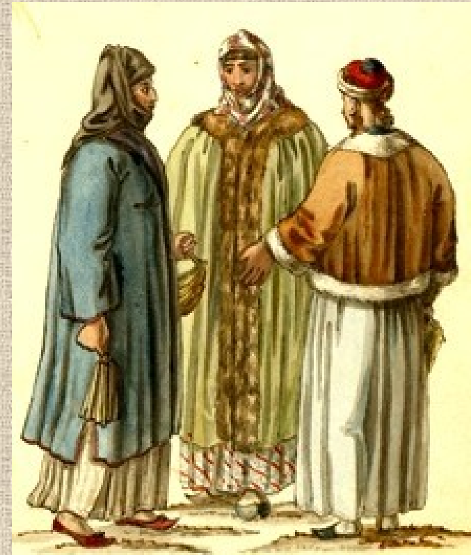
Fanariotští Řekové představovali významnou menšinu v Osmanské říši a z jejich řad vzešlo i mnoho vysokých osmanských úředníků