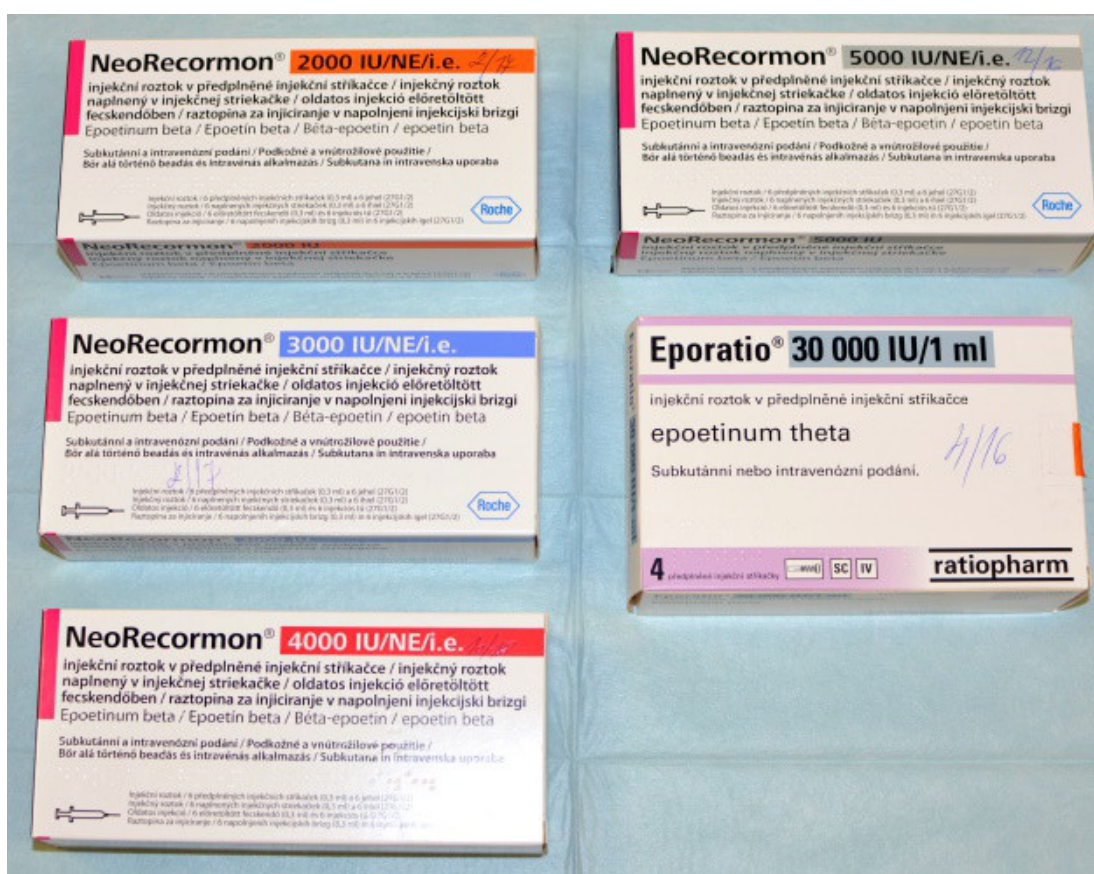
Obrázek 5: Léky k léčbě anémie