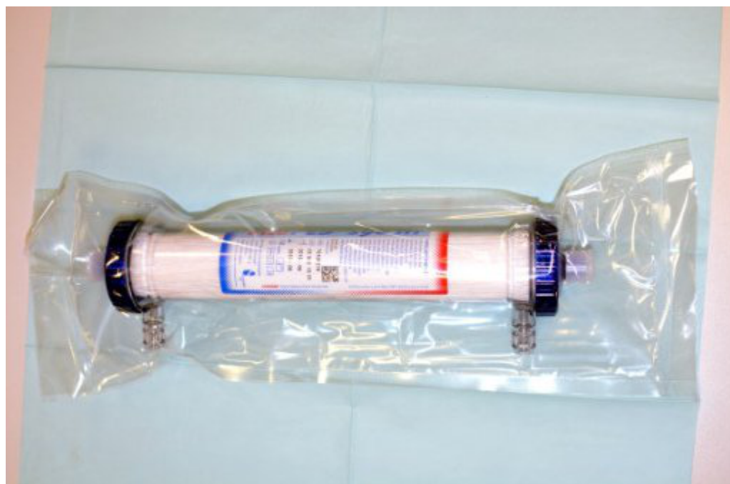
Obrázek 6: Dialyzátor