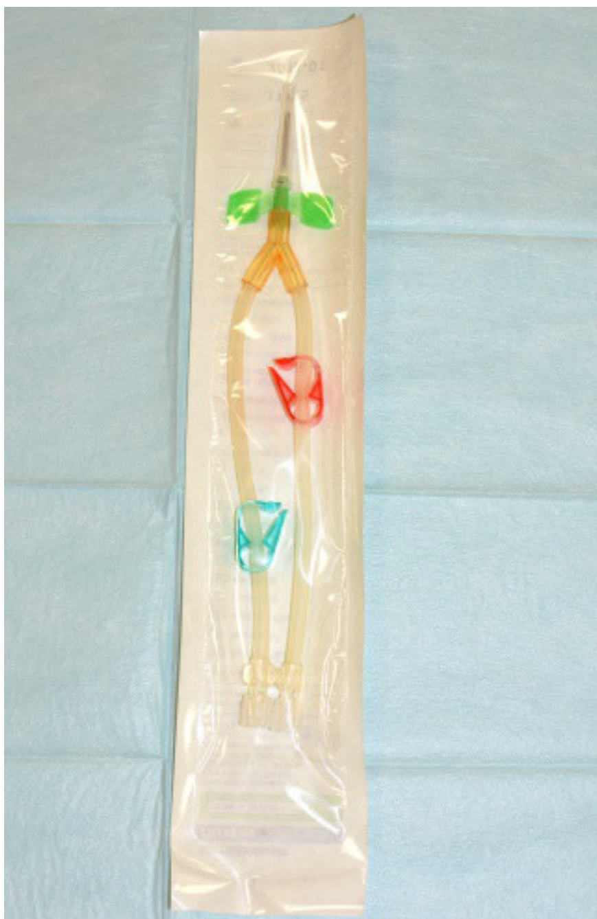
Obrázek 2: Jehla Single Needle