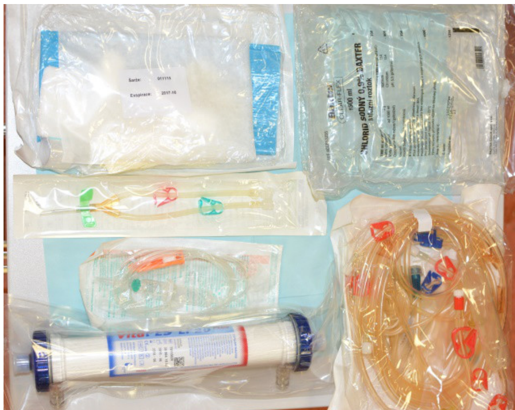
Obrázek 8: Pomůcky k dialýze