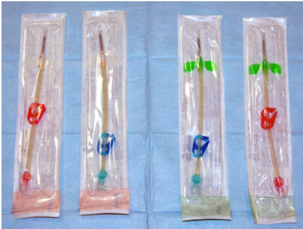
Obrázek 3: Jehly k dialýze