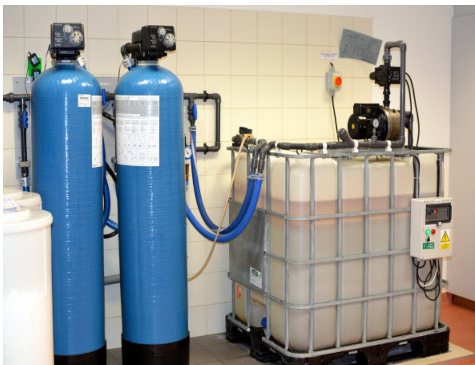
Obrázek 11: Úpravna vody