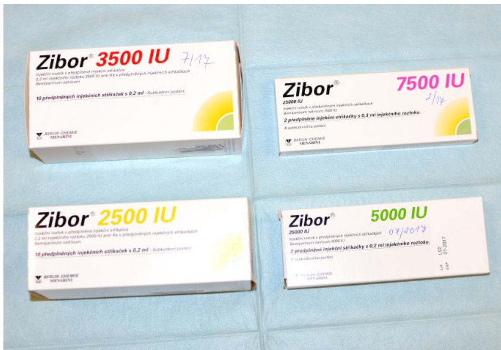
Obrázek 4: Antikoagulantia