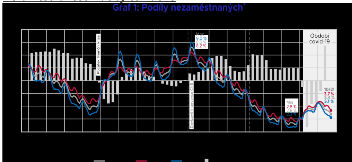
Graf 1: Podíly nezaměstnaných*

Podíl nezaměstnaných na úřadech práce v populaci 15–64 let na konci října '21 (3,4 %) byl oproti před- -covidovému říjnu '19 vyšší o 0,8 procentního bodu (p.b.), u mužů o 0,7 p.b. a žen 0,8 p.b. (Grafy 1 a 4). Od března '21 se situace mužů zlepšuje výrazně dynamičtější než žen.