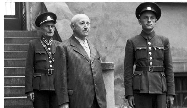
Pomnichovský předseda vlády Rudolf Beran před Národním soudem