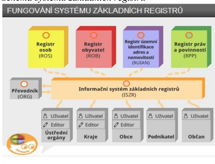
Schéma systému základních registrů