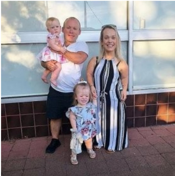
Gigantizmus a nanizmus