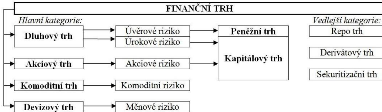
Obrázek 1: Členění finančního trhu