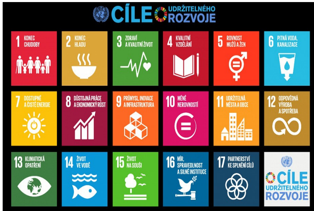
Cíle udržitelného rozvoje

SLEZSKÁ UNIVERZITA OBCHODNĚ PODNIKATELSKÁ FAKULTA V KARVÍNĚ