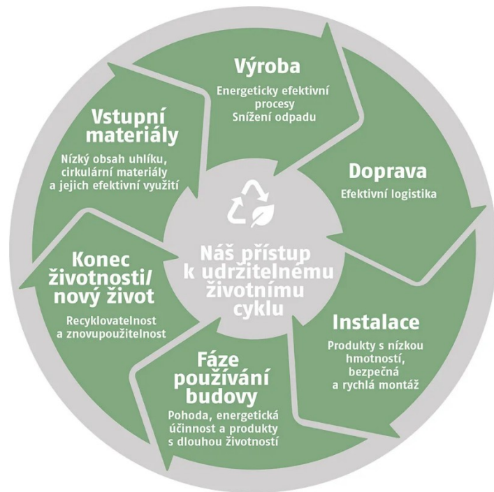
Ukázka životního cyklu výrobku