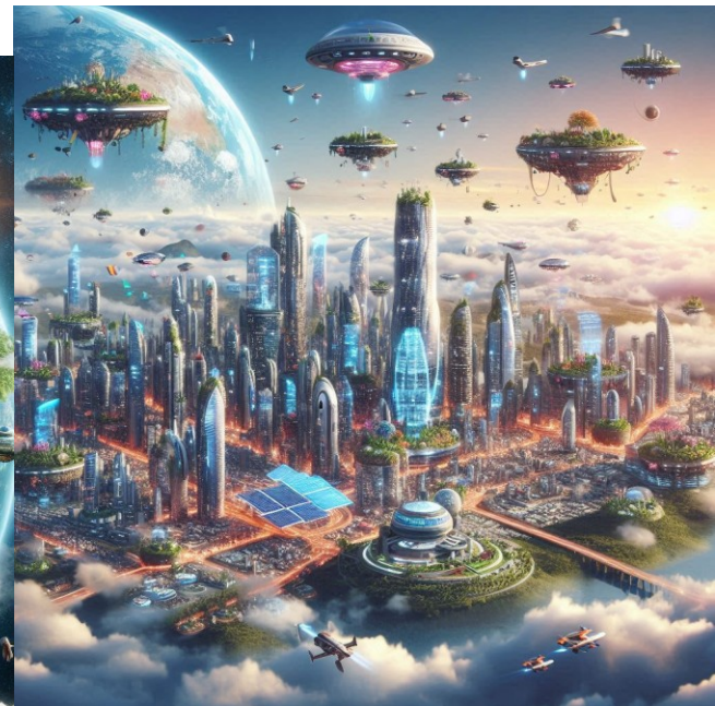
In 10 000 years (Copilot)