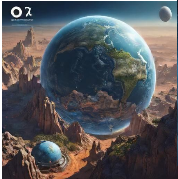
In a thousand years (deepai.org)

AI prompt „Design a picture of the earth in a thousand/10 000 years“.