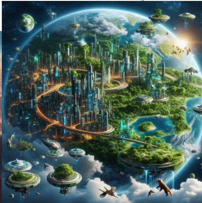
In a thousand years (Copilot)